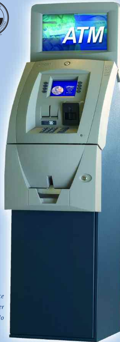
9100 en bronce bayou con topper retroiluminado